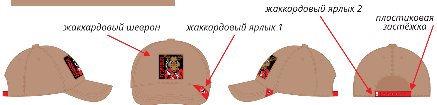
вид сбоку вид спереди вид сбоку вид сзади вид сверху 压线配布色 вид снизу

снизу козырька тоже отстрочка, Pantone 485 C